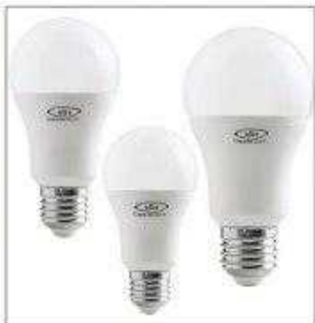
لامپ‌های خاص خانگی Home LED Bulbs