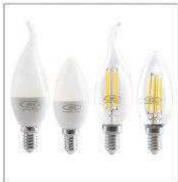
لامپ‌های شمعی LED Candle Bulbs