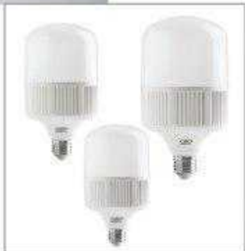
لامپ‌های خاص فروشگاه Shop LED Bulbs