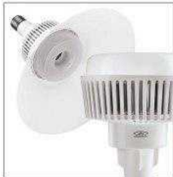
لامپ‌های صنعتی Industrial LED Lights